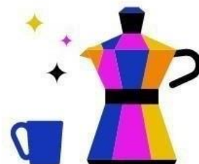
Kantine & Café- Bar