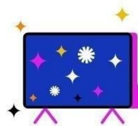
Kostenfreier Zugang zu RTL+