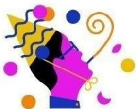
RTL Events & Partys