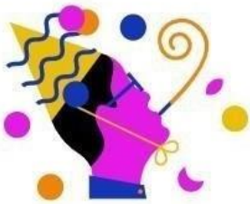
RTL Events & Partys