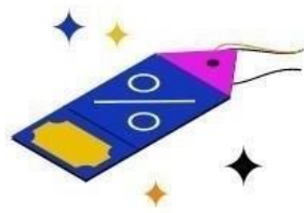
Mitarbeiter- Angebote & - Rabatte