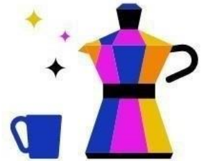
Kantine & Café- Bar