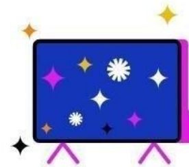
Kostenfreier Zugang zu RTL+