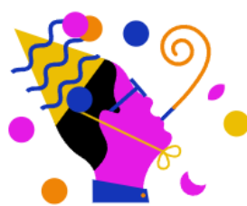
RTL Events & Partys