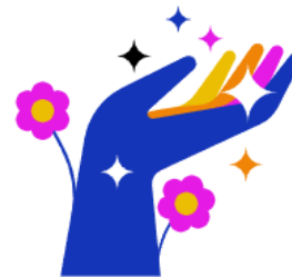
Teamspirit & Vielfalt