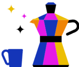
Kantine & Café- Bar