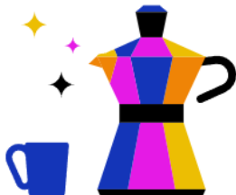
Kantine & Café- Bar