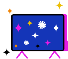
Kostenfreier Zugang zu RTL+