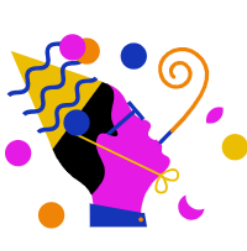
RTL Events & Partys