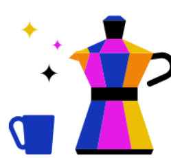
Kantine & Café- Bar