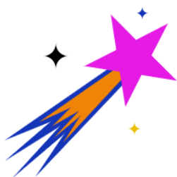
Förderung von Talenten