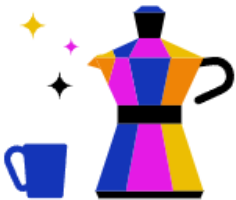
Kantine & Café- Bar