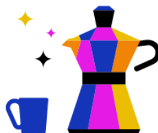
Kantine & Café-Bar