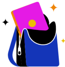
Mobile Office möglich